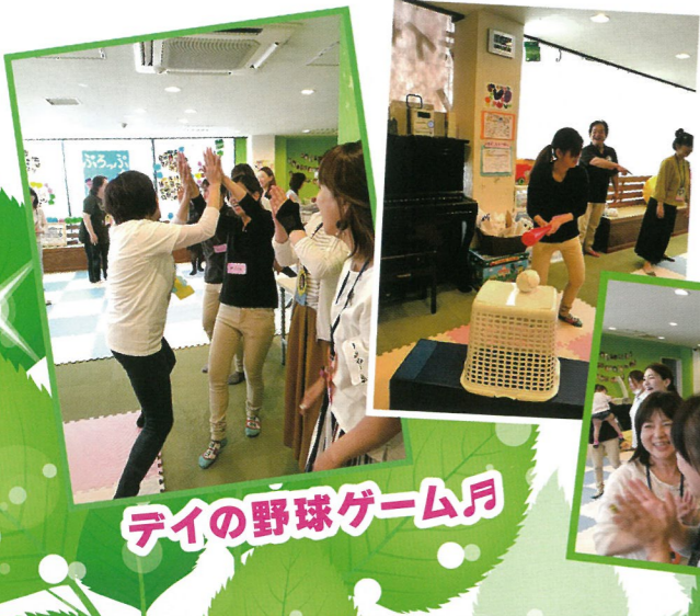
テイの野球ゲーム月