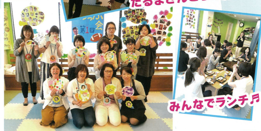
みんなでランチ月