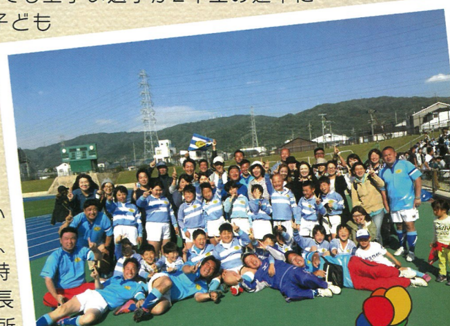
新チームになって初めての勝利!!

現在受け持っている学年が小学校4年生で、幼児の頃から指導させていただいていますが、2年生の途中までは上手い子どもたちがいたおかげもあって、関西では負け知らずのとても強いチームでした。しかし、「2年生全員で上手くなろう!」「上手くない子どもたちも一緒に楽しくラグビーをしよう!」というチームの方針と、上手い子どもたちの親御さんとの考えの違いで、とても上手い選手が2年生の途中にごっそりと違うチームに移籍してしまいました。当然上手い子どもたちが抜けたチームは連戦連敗を重ね、コーチ陣、親御さん、何より子どもたちにとってとても辛い時期が続きました。2年生の途中から4年生の春の大会まで1度も勝つことがないくらいです…。ところが、GWに行われた大会で新チームになって初めて勝つことができました!それも去年の大会で15対0で負けたチームに逆転で勝利しました!! 連戦連敗で悔しい思いをずっとしていましたが、それでも諦めずに一年半しっかりと練習を重ねた結果だと思えます。簡単に一年半と言っても、小学校低学年の1年半は僕たち大人にとってのどれくらいの時間の長さになるのでしょうか? 子どもたちにとっては、とても長く辛い時間だったと思います。勝利した後、スクールの集合場所に帰って来たときに他の学年のすべてのコーチ、親御さん、子どもたちからたくさんのお話をいただきました。みんな4年生の辛い状況を知っていて、常勝チームにとってはたったひとつの勝利ですが、それがどれ程大きなことかを分かってくれていたからその大きな拍手だったと思います。10年コーチをしています、あんなことは初めてのことで!! 当然4年生のコーチ陣、親御さんは嬉しさを超えてみんなの頑張りや泣いていましたが、子どもたちはあっけらかんとしていました…。たぶん、今までの背景など全然関係なく、しんどい練習を頑張っただけで勝つことができた喜びしかないのだろうなあと感じました。そしてこの勝利を通して、その後子どもたち一人一人の練習への取り組みにも少し変化が出てきて、「次も勝てるようにはどうすれば良いのか?」を自分たちで考えられるようになりました。それに伴って、結果もついてくるようになってきました。