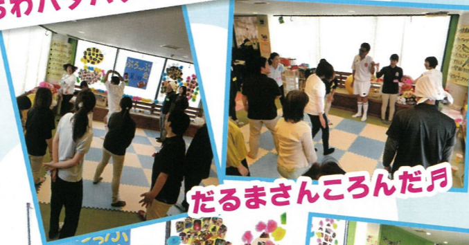
だるまさんころんだ月