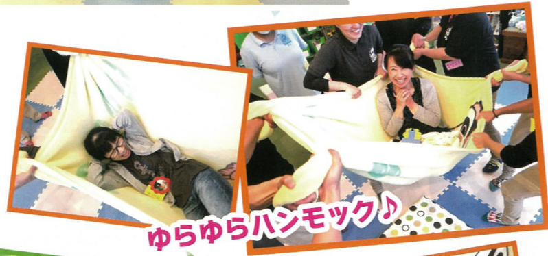
ゆらゆらハンモック♪