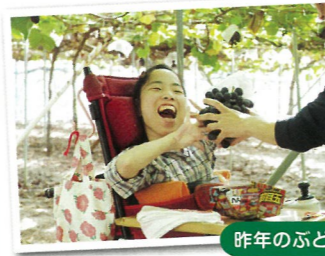
昨年のぶどう狩り

秋はぶどう狩りに出かけましたが、春はみなさんのお声で多かったいちご狩りにでかけます(^ ^)