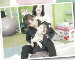
国際リドルキッズ協会