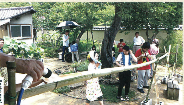
奈良親子レスパイトハウスの詳細については、こちらをご覧ください。

2010年に設立されて以降、毎年春から秋にかけて全国からたくさんのお子さんとそのご家族が主治医同伴で泊まりに来られたり、日帰りで遊びに来られたりしています。そして、お花見や流しそうめん、東大寺境内の散策や若草山山頂へ登ったり、地元の食材でおいしい手料理が振舞われ各季節の風物詩を味わえるさまざまな活動が行われます。これらは、医療制度や社会福祉制度によらない活動のため、スタッフと多くのボランティアによって継続されています。僕も毎年ボランティアに行かせていただいているので、今年も夏の恒例行事「流しそうめん」に参加しました。いつからなのか…僕の役割は広い庭を隅から隅まで草刈りをし、落ち葉拾いをする事に決まっています。今年は、ほんとに熱中症の危険を感じるほど大変でした。地元の方々や学生ボランティアのみなさんは、おいしい食事の準備や子どもたちが楽しく過ごせるように準備をされます。今回は、大阪と兵庫から4家族が参加されました。みなさんお昼前には集合されるのですが、子どもたちが到着するとすぐに着替えを済ませ、庭掃除のおっちゃんからヘルパーさんに変身します!今年もみんな、流しそうめんやスイカ割り、東大寺散策などをして、夏の楽しいひと時を一緒にさせていただきました。毎年この時期は親子連れの鹿がたくさんいるので、その姿を見ながら「かわいいねえ~♡」と言ったり、大仏さまの大きさにみんなでビックリしたりするのですが、やはりこの酷暑!鹿は影に隠れて出てこないし、暑すぎて大仏さままでの道のりが危険で見に行けないということで、ほぼクーラーの効いた親子レスパイトハウスの中で過ごしました。暑さで予定変更もありましたが、初めてスイカ割りをしたお子さんや初めて竹の本格的な流しそうめんをされた方など4家族それぞれの夏の思い出ができたようで、みなさんとても良い表情で帰られました。