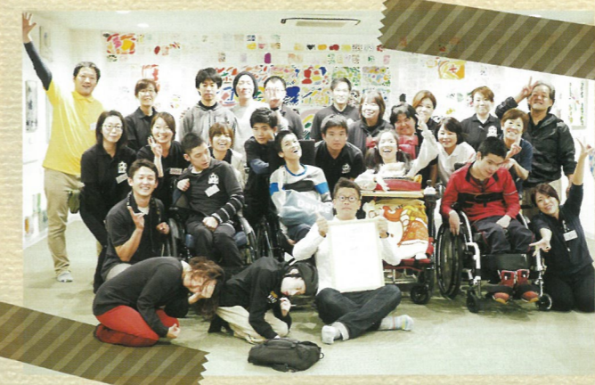
横沼アート展のスタッフです!

僕が会社を作るときに考えたのは、この3つだけです。会社を続けるにあたって、大切なことは全てここに集約されていると思っています。この理念の実現のために、たくさん考えて日々試行錯誤しながら会社の運営を行っていますが、バシッとくる答えにはまだ辿り着けていません。少しでも早く環境を整え、みんなにとっての楽しい場所で、しっかりとなが〜く続けていける会社組織にしていきたいと思っています。