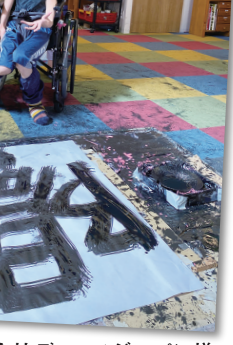
辻中鉱業株式会社様 株式会社ディエスジャパン様