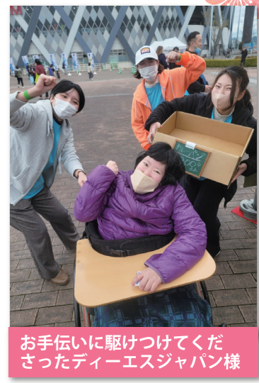
お手伝いに駆けつけてくださったティーエスジャパン様